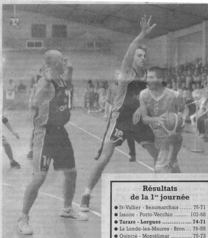
Une entame de championnat encourageante

M AGNIFIQUE succès ! Les rouges ont offert ce samedi, sous les yeux de plus d'un demi-millier de spectateurs, le plus beau des cadeaux aux dirigeants, staff et entraîneurs de l'A.S.T. Une victoire acquise en extremis grâce à une combativité exceptionnelle qui ouvre la saison de manière très encourageante.